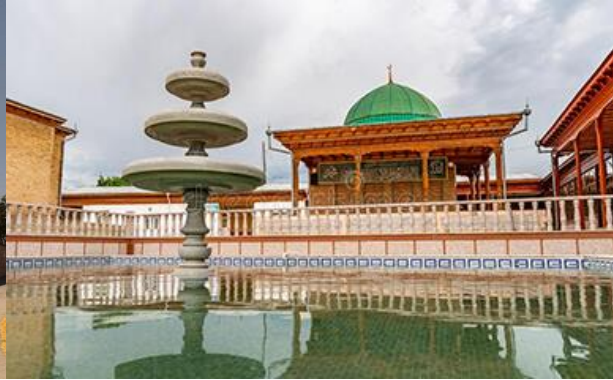
กลุ่มอาคาร khazrati shoh