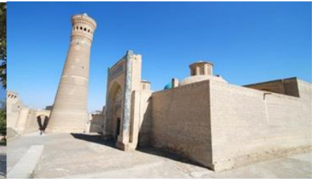
หอโพลี คัลยาน