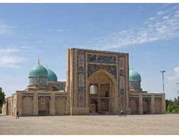
Hazratl Imam Complex