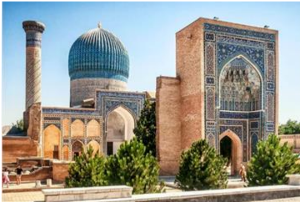
สถานที่ฝังศพอาเมียร์

สามารถปกครองดินแดนได้มากกว่าใครในประวัติศาสตร์ ถูกสร้างเมื่อปี ค.ศ.1399 ใช้เวลาก่อสร้างนาน 5 ปี ใช้ช่างฝีมือ 200 คน แรงงาน 500 คน ช่างอีก 95 เชือก ด้านประตูทางเข้าสร้างเป็นอาคารสูงประมาณ 35 เมตร ทางเข้าสร้างเป็นรูปวงรี สูง 18 เมตร ตัวหอบังสูงประมาณ 50 เมตร ตรงทางเข้าสู่จัตุรัสมีสี่เหลี่ยมขนาดพื้นที่ยาวประมาณ 167 เมตร และกว้าง 109 เมตร และสองข้างยังมีสี่เหลี่ยมขนาดเล็ก โดยเฉพาะตัวโดมได้กลายเป็นสัญลักษณ์ของเมืองนี้ ภายในตกแต่งด้วยหินอ่อนแกะสลักโมเสครูปร่างต่างๆ เคลือบด้วยสีฟ้าดงาม เขียนภาพและอักษรด้วยสีน้ำเงินและทอง และที่หน้าสุเหร่ายังมีแท่นซึ่งเดิมวางคัมภีร์อัลกุรอานที่ใหญ่ถึง 2 เมตร