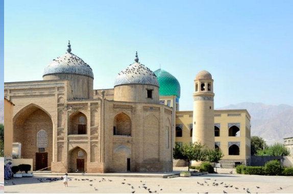
Sheikh Muslihiddin Mausoleum