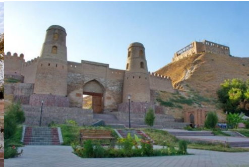
ป้อมปราการฮิสซาร์

Day 5 อังคารที่ 4 มิ.ย. ดูชานเบ - เพนจิกเคนท์ - ซามาร์คานด์ (อุซเบกิสถาน)