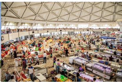
ตลาดคอร์ดชู