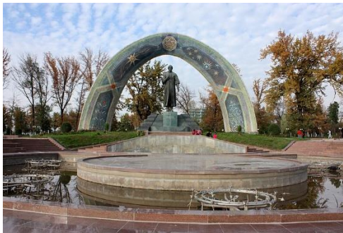
สวนสาธารณะรูดาภิ