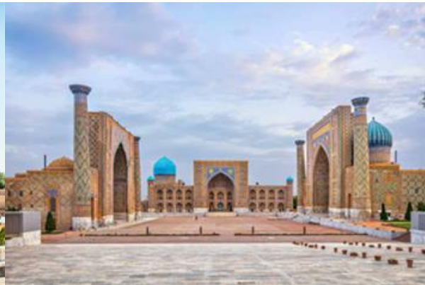
จัตุรัสเรจิสถาน