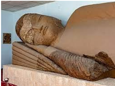
พิพิธภัณฑิ์โบราณวัตถุแห่งชาติ

นำท่านเข้าสู่ที่พัก Atlas Hotel หรือเทียบเท่า