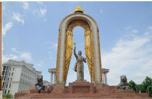
อนุสาวรีย์อิสมาอีล ซามานี