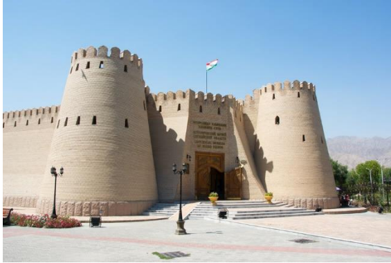
ปราสาทาเมมาริค

f Destination of Journey-DOJ 📺 destinationofjourney.doj