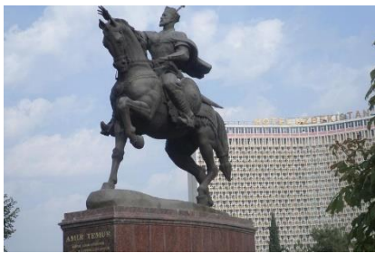
จัตุรัสอามิร ติมูร์

13.10 น. เดินทางถึง สนามบินเมืองทาชเคนท์ (Tashkent International Airport) หลังผ่านพิธีตรวจคนเข้าเมืองและศุลกากร แล้ว นำท่านเดินทางเข้าสู่ เมืองทาชเคนท์ (Tashkent) เป็นเมืองหลวงที่ตั้งอยู่ทางทิศตะวันออกของประเทศ มีความหมายว่า เมืองแห่งศิลา (The City of Stone) เป็นเมืองที่ใหญ่ประกอบไปด้วยโรงงานอุตสาหกรรมและเป็น ศูนย์กลางของวัฒนธรรมในเอเชียกลาง มีประชากรประมาณ 2 ล้านคน นำท่านชมความสวยงามของเมืองหลวง ซึ่ง ตั้งอยู่บนเส้นทางสายไหมจากจีนสู่ยุโรป นำท่านชม จัตุรัสเสรีภาพ หรือ จัตุรัสมุสตาคิลิก (Independence Square หรือ Mustakillik Square) เป็นหัวใจของเมืองและเป็นสัญลักษณ์แห่งอิสรภาพของคนในชาติ ชม จัตุรัสอามิร ติมูร์ (Amir Timur Square) หัวใจตัวอนุสาวรีย์ทำจากสัมฤทธิ์ เป็นรูปติมูร์ประทับบนหลังม้าอย่างสง่างาม เผย แล้วนำชม โรงเรียนสอนศาสนาบาร์กขาน (Barak Khan Madrased) จากนั้นนำท่านสัมผัสความงามของกลุ่มสถาปัตยกรรม Hazratl Imam Complex ซึ่งเป็นสถานที่ศักดิ์สิทธิ์เก่าแก่ของชาวมุสลิมที่มีมาตั้งแต่ศตวรรษที่ 6 ประกอบไปด้วยสิ่งปลูก สร้างที่ยิ่งใหญ่ เช่น มัสยิด โรงเรียนสอนศาสนาและพิพิธภัณฑ์ที่เก็บรวบรวมคัมภีร์กูรอ่านเก่าแก่ไว้มากมาย อีกทั้งยังเป็น ที่เก็บรักษาคัมภีร์กูรอ่านที่มีขนาดใหญ่ที่สุดอีกด้วย จากนั้นนำท่านไป ตลาดคอร์ดชู (Chorsu Bazaar) ซึ่งครั้งหนึ่ง เคยเป็นตลาดที่ยิ่งใหญ่ในเอเชียกลางและบนเส้นทางสายไหม ที่อยู่ภายใต้โดม 7 โดมชายผลิตภัณฑ์ต่างๆ สัมผัสกับ บรรยากาศแบบย้อนยุค พร้อมเลือกซื้อสินค้าในตลาดบาซาร์ที่มีทั้งผ้าแพร พรม เครื่องทองเหลือง ผ้าขนสัตว์ เครื่อง หนึ่ง และสินค้าพื้นเมืองมากมาย