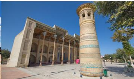
สุเหร่าไม้