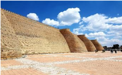
ป้อมดิอาร์ค

นำท่านชม ด้านนอกและถ่ายรูปกับ ป้อมดิอาร์ค ป้อมปราการแห่งบูคาร่า (Ark of Bukhara) ซึ่งเป็นป้อมเก่าแก่สร้างในศตวรรษที่ 5 ตั้งอยู่ใจกลางเมือง และเมื่อขึ้นไปด้านบนของป้อมจะสามารถเห็นวิวทิวทัศน์ของเมืองได้อย่างชัดเจน มีกำแพงล้อมรอบมีความยาวประมาณ 800 เมตร ส่วนของกำแพงมีความสูงถึง 16-20 เมตร ถูกสร้างด้วยอิฐหนาที่บและสูงใหญ่ ส่วนประตูมีซุ้มโค้งและหอคอยทั้งสองด้าน ซึ่งในอดีตภายในถูกใช้เป็นศูนย์กลางการปกครอง ชม สุเหร่าไม้ (Bolo Hauz Mosque) เป็นอาคารสุเหร่าในสมัยกลาง ถูกสร้างขึ้นปี ค.ศ.1712-1713 รูปแบบในการก่อสร้างประกอบไปด้วยเสาไม้ที่มีความสูงมาก อาคารด้านหน้ามีเสาไม้ประดับมากกว่า 20 ต้นรองรับแดดฟ้าหลังคา ต่อมาในปี ค.ศ.1917 ก็ได้ใช้สถานที่แห่งนี้เป็นสุเหร่าอย่างเป็นทางการมาจนถึงปัจจุบันนี้ ชม หอโพลี คัลยาน (Poli Kalyan Ensemble and Kalon Minaret) ถูกสร้างขึ้นใน ปี ค.ศ. 1127 โดย อาสลาณ ช่าน แห่งราชวงศ์คารานิด อยู่ในการปกครองของบูคาร่า และสามารถทำให้ผู้พบเห็นต้องตกตะลึงถึงความโอ่อ่างดงามในรูปร่างของหอนี้ ส่วนที่สูงที่สุดเป็นทรงกลม หอนี้ได้ถูกออกแบบเพื่อใช้ในการทำละหมาดของชาวมุสลิม หอคอยแห่งนี้ได้ถูกซ่อมแซมขึ้นใหม่ในศตวรรษที่ 15