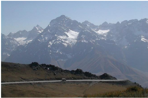
ช่องเขาแอนซอพพาส