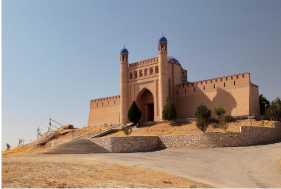
ป้อมปราการมัคเทปเป

f Destination of Journey-DOJ 📺 destinationofjourney.doj