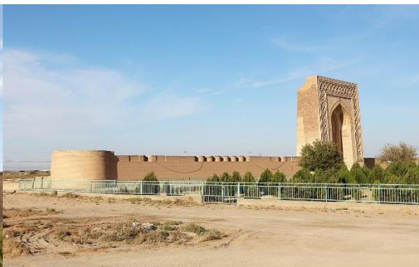
คาราวานซารายราบาติ มาลิก